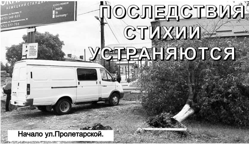
Начало ул. Пролетарской.

Не на шутку разбушевалась стихия в Ардоне вечером 4 июня. Практически сразу в администрации района состоялось экстренное заседание комиссии по чрезвычайным ситуациям и обеспечению пожарной безопасности с участием городских властей. Шквалистый ветер и ливень с градом обусловили введение режима ЧС. Были выработаны решения и действия в данных обстоятельствах, привлечены силы и средства жизнеобеспечивающих предприятий Ардона.